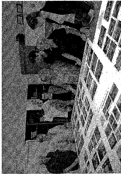
Gli organizzatori del progetto «Viaggio nella storia del quartiere»

Atas, Polo sociale e "Il Seme" organizzano l'incontro tra vecchi e nuovi residenti. Una mostra fotografica ripercorre la storia e un video riflette sull'oggi